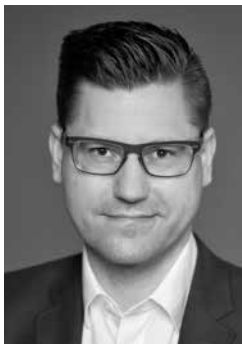
Abbildung: Hilmig &amp; Vosstreck Fotografie